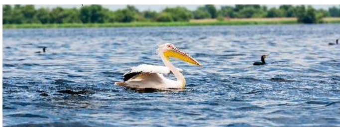
Pelikan im Donaudelta