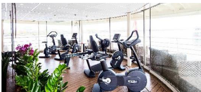
MS Nestroy, Fitnesscenter mit Panoramaaussicht