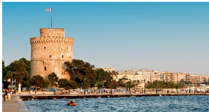
Thessaloniki, Weißer Turm