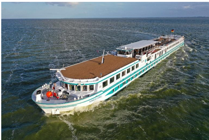
MS Junker Jörg