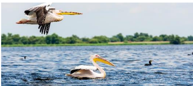
Pelikane im Donaudelta