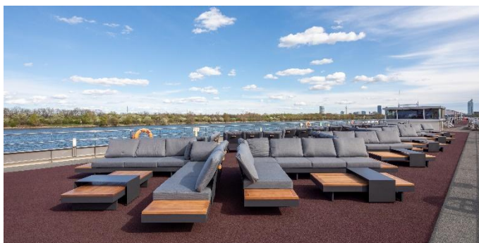
MS Nestroy, Lounge Sonnendeck