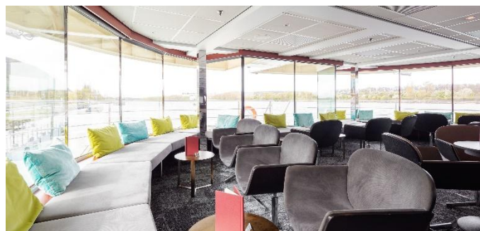
MS Nestroy, Panoramabar