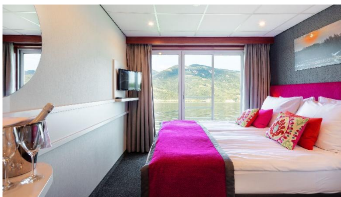
MS Nestroy, Doppelkabine Schiller- / Goethedeck

Die An- und Ablegezeiten gelten als Richtzeiten. Änderungen des Reiseverlauf und Ausflugsprogramm bleiben vorbehalten.