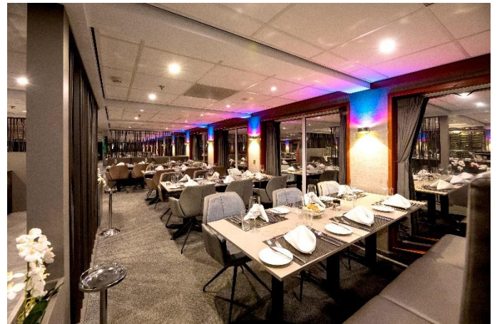
MS Nestroy, Restaurant