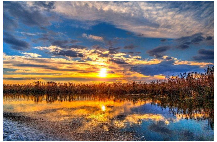
Donaudelta bei Sonnenuntergang