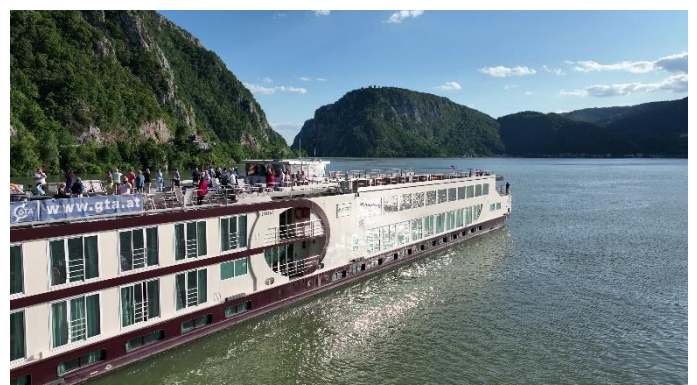
MS Nestroy im Eisernen Tor