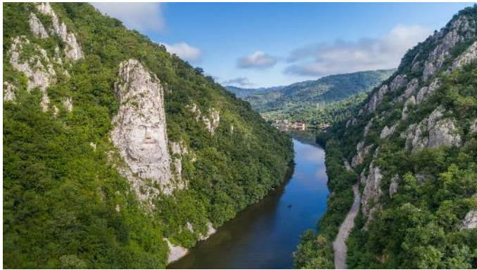
Eisernes Tor mit Decebal