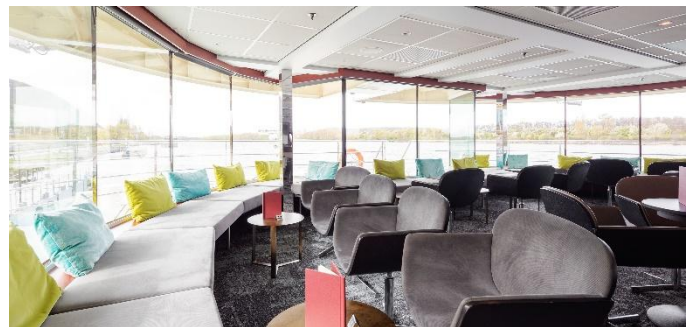
MS Nestroy, Panoramabar