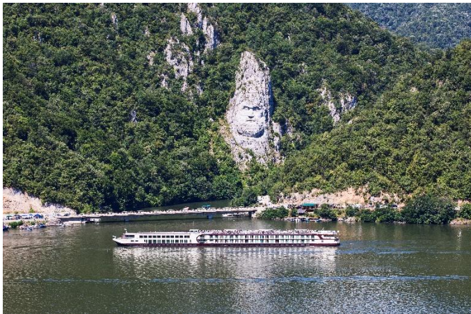
MS Nestroy mit Decebal (Eisernes Tor)