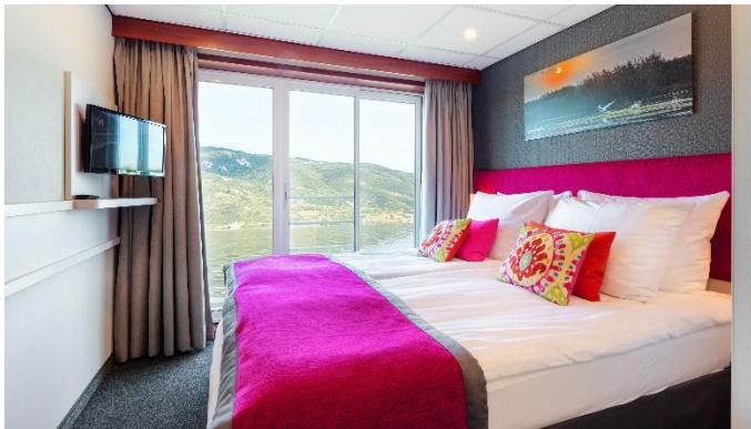
MS Nestroy, Doppelkabine Schiller- / Goethedeck