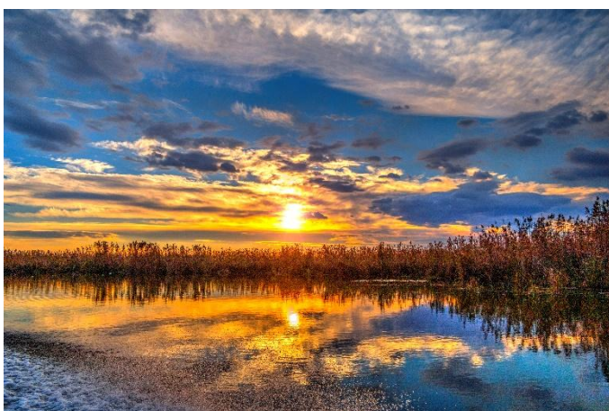
Donaudelta bei Sonnenuntergang