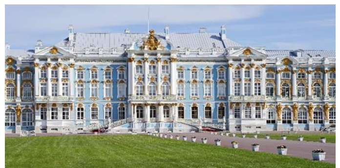
Katharinenpalast, St. Petersburg

Veranstalter: GTA-SKY-WAYS Reiseveranstaltungs GesmbH