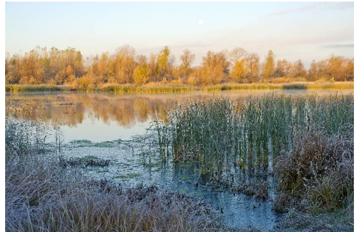
Flusslandschaft in Sibirien