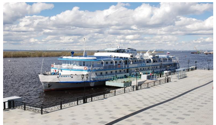
MS Remix, Sonnendeck

Nach dem Transfer zum Flughafen treten wir unsere Heimreise an.