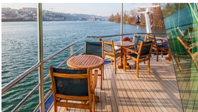
MS Klimt, Cellodeck, Außenbereich