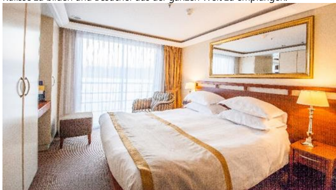
MS Klimt, Doppelkabine Cello- bzw. Violindeck

Haag, Zoetermeer und Venlo ist im Jahr 2022 Almere an der Reihe, die grüne Kulisse zu bilden und Besucher aus der ganzen Welt zu empfangen.