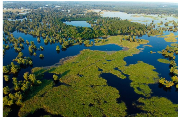
Nationalpark Kopački rit