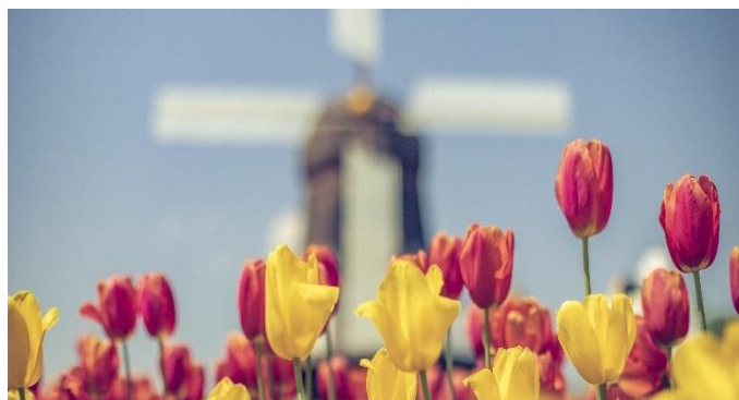
Windmühlen & Tulpenfelder