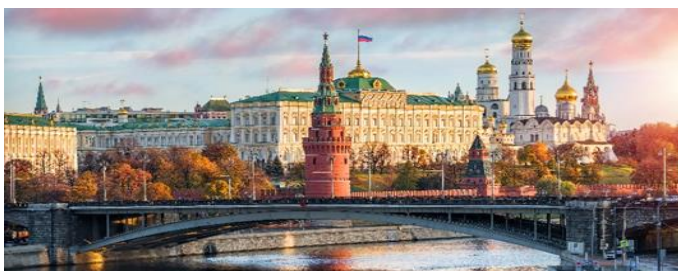
Moskawa und Kremel, Moskau

Bei Buchung benötigen wir als Reiseveranstalter eine Kopie des für diese Reise gültigen und genutzten Reisepasses.