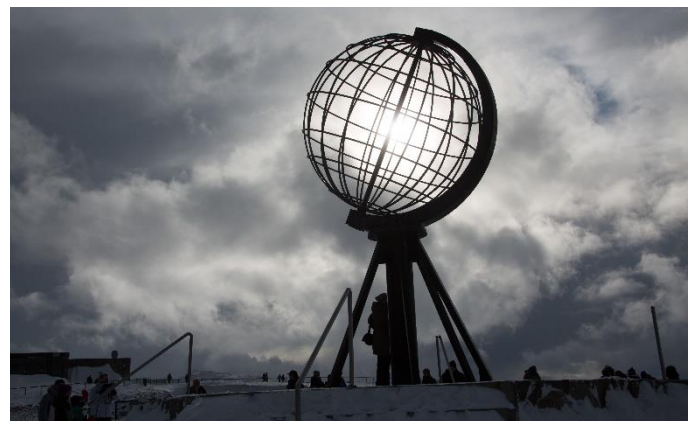
Nordkap Kugel im Winter