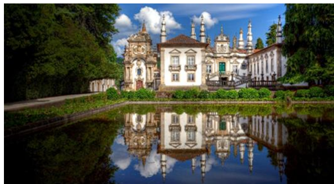
Schloss Mateus, Vila Real