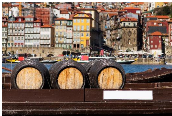
Rabelo Boot, Porto