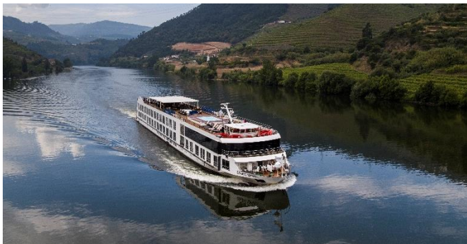
MS Douro Spirit