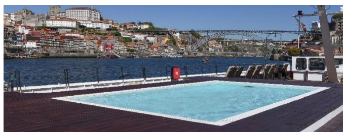
Pool am Sonnendeck

*Kat. G & J: keine Einzelbelegung möglich