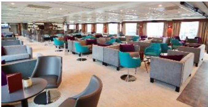
MS Nestroy, Bar/Lounge