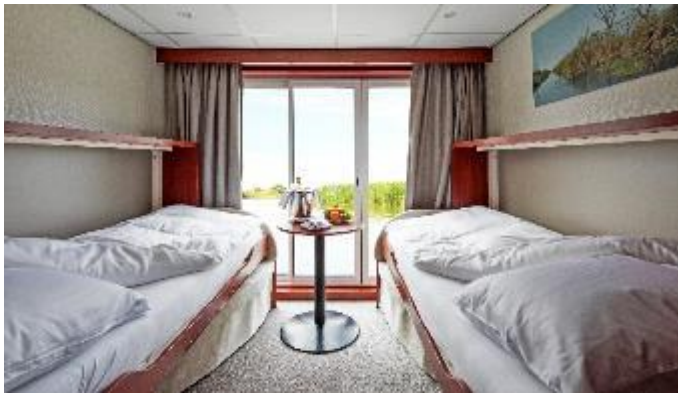
MS Nestroy, Zweibett-Kabine Schiller- bzw. Goethedeck