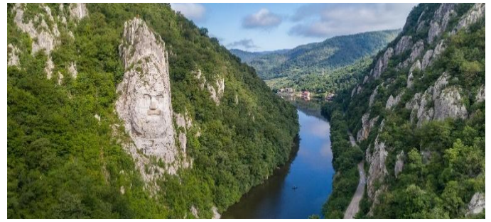
Eisernes Tor mit Decebalus-Statue

Heute erleben wir einen der landschaftlich reizvollsten Abschnitte und das Highlight unserer Donaukreuzfahrt. Das Eisernen Tor, ein 100 km langes Durchbruchstal zwischen dem Balkangebirge und den Karpaten, mit 600 Meter hohen Felswänden, bietet eine spektakuläre Landschaft. Während dem zünftigen Frühshoppen auf dem Sonnendeck öffnen sich die grenzenlos scheinenden Weiten der südlichen Walachei. Wir drehen bei der Statue des Decebalus und beginnen die Rückfahrt flussaufwärts.