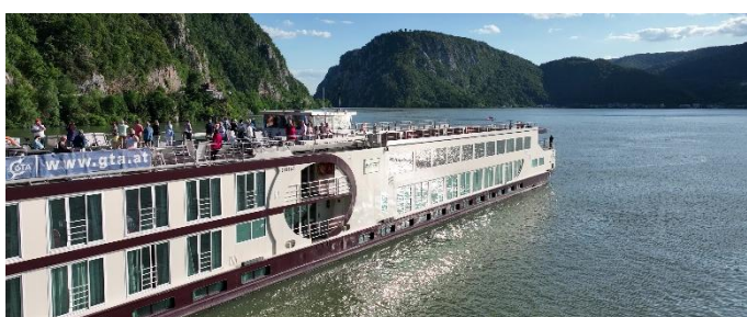
MS Nestroy im Eisernen Tor

Es gelten die verbindlichen allg. Geschäftsbedingungen der neuesten Fassung. Alle Preisangaben sind in Euro und gelten pro Person. Preis- und Programmänderungen vorbehalten. Tippfehler vorbehalten! Mindestteilnehmerzahlen: Kreuzfahrt 180 Personen je Termin, Ausflugspaket 20 Personen je Termin/Paket. © Copyright – Alle Fotos sind urheberrechtlich geschützt und sind nicht zur Weiterverwendung gedacht. Veranstalter: GSW Touristik AG Bitte beachten Sie die Geschäftsbedingungen unter www.gta.at/geschaeftsbedingungen/