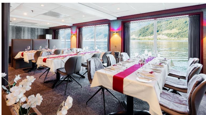
MS Nestroy, Restaurant