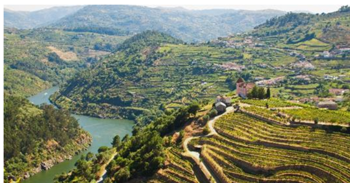
Weinterrassen Douro Tal