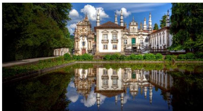
Schloss Mateus, Vila Real