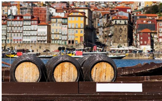
Rabelo Boot, Porto