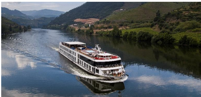
MS Douro Spirit